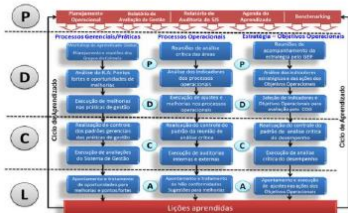
Fig. 03 Aprendizado Organizacional da UGR

Após conclusão das etapas, realizamos o aprendizado da prática (PDCL) e chegamos à seguinte melhoria para atuação em áreas de baixa renda: realizar pesquisa pós-serviço, para medir os pontos positivos e melhorar o processo para a próxima atuação; e utilizamos a ferramenta 5W2H com o objetivo de visitar as comunidades alvo do projeto a cada três meses.